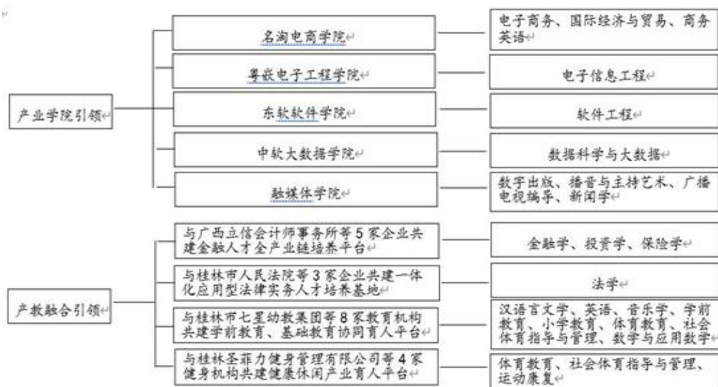
图2 产业学院、协同育人平台情况一览表

面向基层需求，明确应用型人才定位，构建专业集群，形成以重点专业为龙头，相关专业为支撑的“文化创意与教育、财经商贸与法律、旅游+运动康养、信息与通信技术”等4大专业集群；建设产业学院，建成校企深度融合的“名淘电商学院”“粤嵌电子工程学院”“东软软件产业学院”“中软大数据产业学院”“融媒体学院”等5个产业学院；搭建协同育人平台，建成一体化的应用型法律实务人才培养基地、金融人才全产业链培养平台、学前教育、基础教育协同育人平台、健康休闲产业育人平台等4个协同育人平台，实现了教育供给和产业需求对接（见图2）。