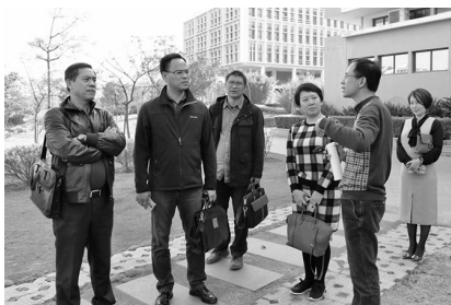
图3: 我校考察团参观厦门南洋学院