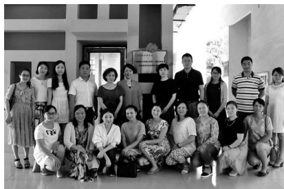
双方领导老师合影留念