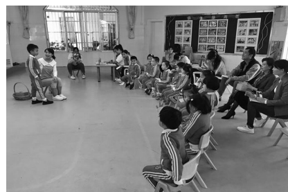
图一：实习老师在给学生授课