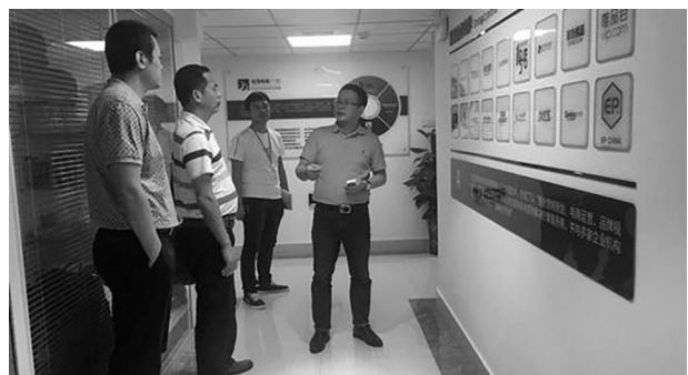
名淘公司负责人向杨校长 一行介绍公司情况