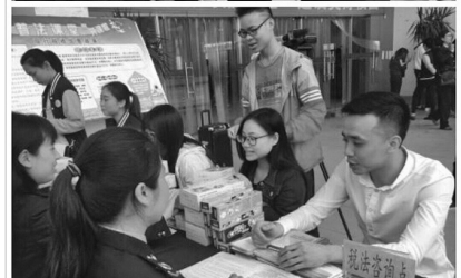
图：同学们积极参与税收政策咨询