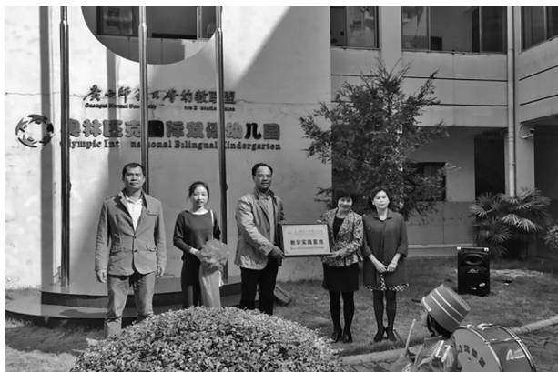
图：教学实践基地授牌仪式