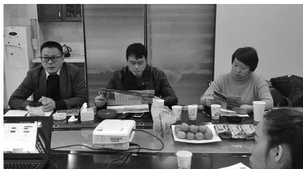
图：校企双方认真研究合作具体事宜

行课程、美工实训课程、速卖通实训课程、天猫国际站实训课程等四类电商专业课程。其课程设置、学习方式和就业保障体系实现了学习真实操、学费零负担、就业零压力的目标。