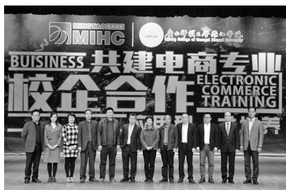
图：与会领导嘉宾合影