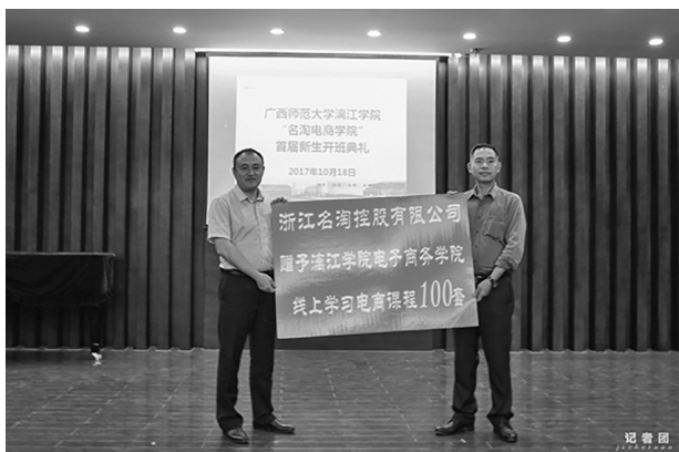
名陶公司向我校捐赠100套线上学习电商课程