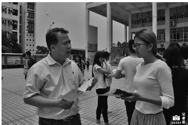
交行负责人向我校学生讲解金融知识