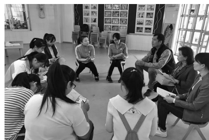
图二：老师们在点评上课情况