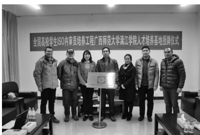
北京国家质量认证培训中心 “全国高校ISO9000内审员人才培 养基地”落户我校