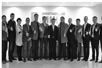
图7: 我校考察团与名淘公司合影留念