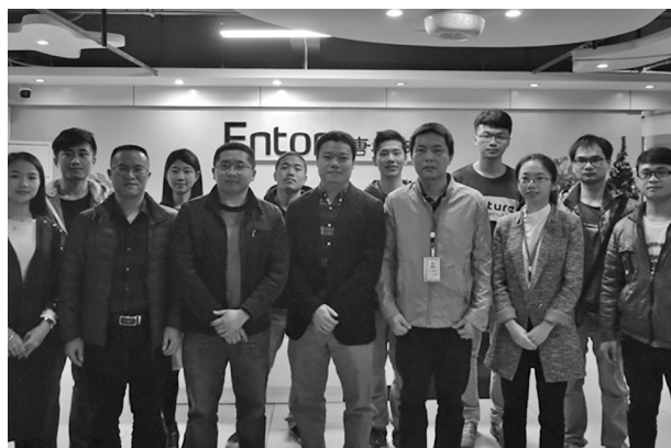
答辩专家小组老师与学生合影

自去年12月我校与南宁易唐软件有限公司（以下简称易唐公司）签订了校企合作协议书后，理工系与易唐公司随即开展了2013级计算机科学与技术专业学生的实习以及毕业设计联合指导的相关工作；按照双方合作的原定计划，3月20日，理工系派出计算机专任教师前往南宁与易唐公司联合开展了2013级计算机科学与技术专业的毕业论文答辩，并取得圆满成功；为进一步推进在专业建设及课外实践方面的后续合作项目的实施打下了坚实的基础。