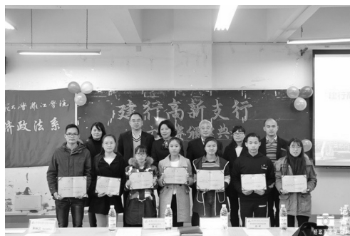
建设银行桂林高新支行人员、我系领导与获奖同学合影