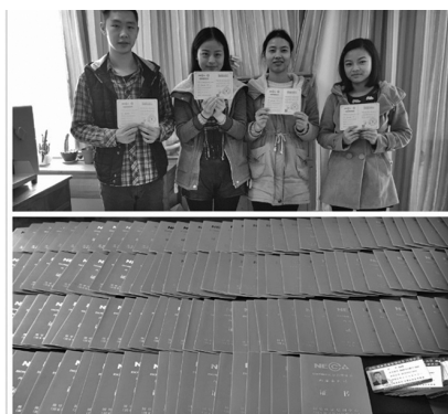
管理系学生喜获ISO9000内审员资 格证

近日，国家质量认证培训中心与我校管理系校企合作签约仪式暨“全国高校ISO9000内审员人才培养基地”授牌仪式在我校隆重举行。国家质量认证培训中心副主任王佳璇，我校杨树喆校长、教务处及管理系教师代表出席了本次签约仪式。