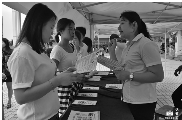
“金融知识进校园”活动在我校开展