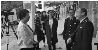
图：学校领导接受广西卫视采访并 与税务局领导交流