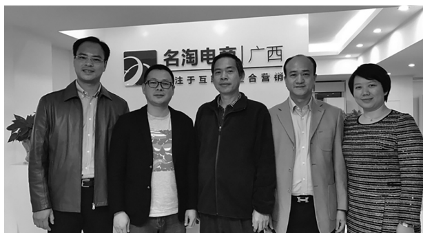
图：双方在签约仪式后合影